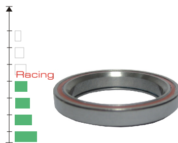
Roulement annulaire ( de série sur modèles « Ca » & O'Light )