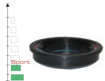
Cuvette Cartouche Monobloc ( modèles Raz « ST » )